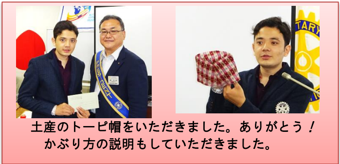
土産のトビー帽をいただきました。ありがとう！ かぶり方の説明もしていただきました。

原処分庁は、請求人の役員であるJ、N及びP(本件各役員)に対する役員給与(本件各役員給与)について、役員給与を受け取っていない旨のJ及びNの申述などから、本件各役員給与は本件各役員に支給されておらず、架空の役員給与である旨主張する。しかしながら、本件各役員はいずれも役員として勤務実態がある上、本件各役員の役員給与の金額が、請求人の取締役会等において承認され、支給時期等は、請求人の従業員と同様に、毎月10日払いとされており、これらの事実に基づいて、請求人は、本件各事業年度において、本件各役員の役員給与の合計額を総勘定元帳の「役員報酬」勘定に計上したのであるから、毎月10日の時点で、請求人の本件各役員の役員給与の当月分の支払債務が実際に確定していたとみるのが相当である。そして、支払債務の確定した本件各役員の役員給与は、請求人において支給事務が行われたと認められるのであるから、本件各役員給与は架空のものとは認められない。